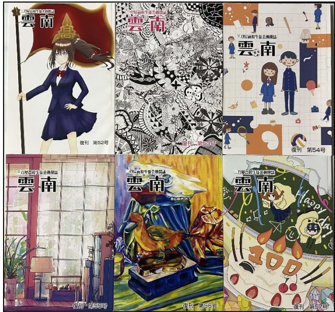
復刊第52号 (左上) から第57号 (右下) 表紙も中身もカラー化しカラフルに