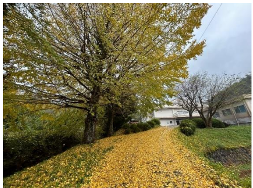
▲体育館に向かう坂道の銀杏