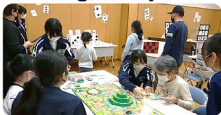
三刀屋高校 JRC(青少年赤十字)部