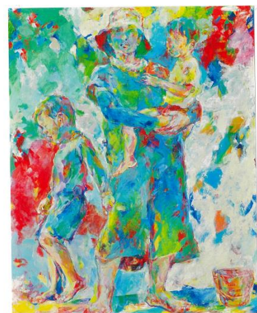
第8回日展(2021) 夏の日 高橋健一