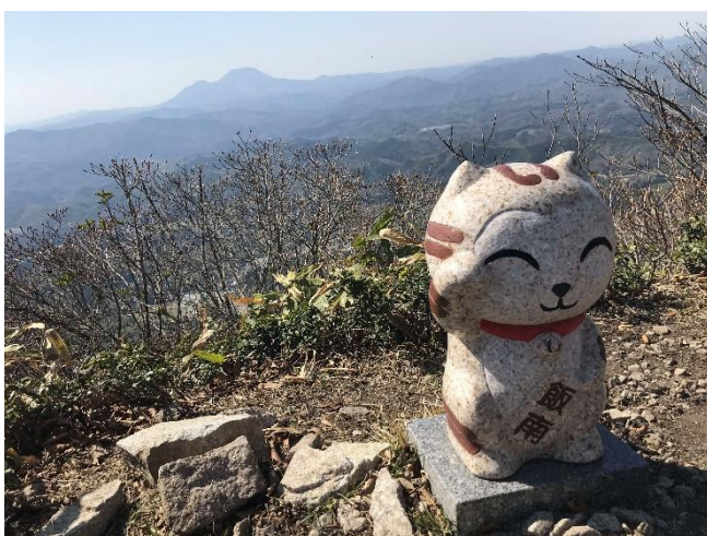
琴引山山頂の様子。 遠方に三瓶山（標高1,126m）も見えます。