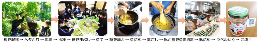
梅を収穫→ヘタとり→加熱→冷凍→糖をまぶし→煮て→糖を加え→煮詰め→裏ごし→瓶と蓋を煮沸消毒→瓶詰め→ラベル貼り→完成!